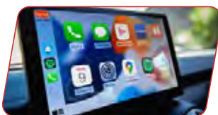
Pantalla touch Apple Carplay y Android Auto