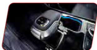
Caja automática 8 velocidades