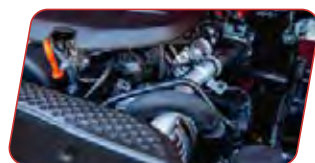
Motor 2.0 turbo bencinero y diésel con hasta 221 HP